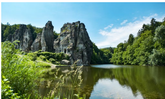
Les attractions touristiques, comme les Externsteine, sont situées à proximité du camping de Lienen.